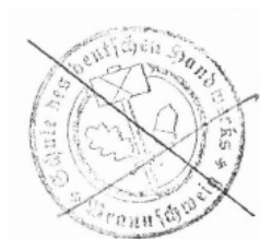
Abb. 2: Stempel der Schule des Deutschen Handwerks in Braunschweig

Mit seinem Amtsantritt im Februar 1935 wurden die Lehrgänge von zwei Wochen auf neun Schultage (ohne Sonntag) gekürzt. 13